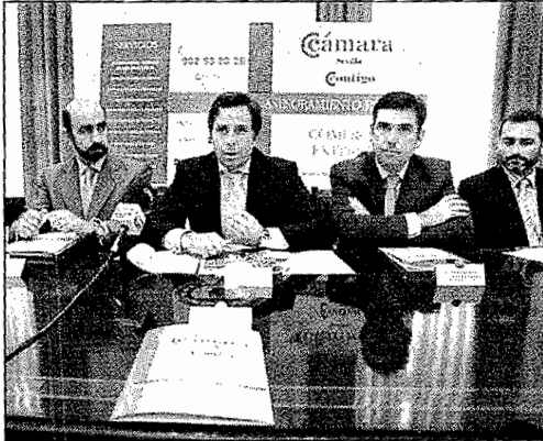
Representantes de la Cámara de Comercio.